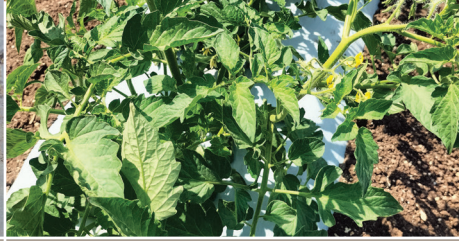
మొక్క నాటిన 20-45 రోజుల వ్యవధిలో