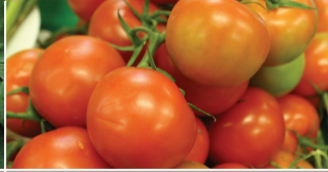
మొక్క నాటిన 96-120 రోజుల వ్యవధిలో (ప్రతి కోత తరువాత మరల వాడండి)