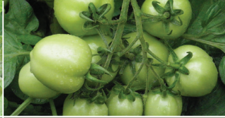
మొక్క నాటిన 71-95 రోజుల వ్యవధిలో