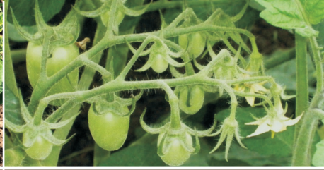
మొక్క నాటిన 45-70 రోజుల వ్యవధిలో